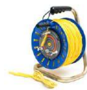
Cable 200 m amarillo para medir la toma de tierra en carrete