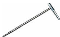
Sonda de medición para clavar en el suelo (30 cm)