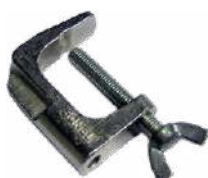
Mordaza (conec- tor tipo banana)