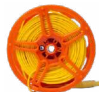
Cable 50 m ama- rillo para medir la toma de tierra en carrete (conec- tores tipo banana)