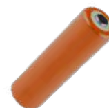
4 x pila alcalina 1,5 V AA, LR6