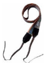
Arnés para el medidor (tipo M1)