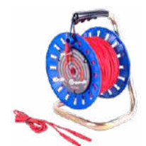
Cable 100 m rojo para medir la toma de tierra en carrete