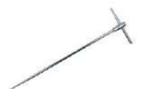
Sonda de medición para clavar en el suelo (80 cm)